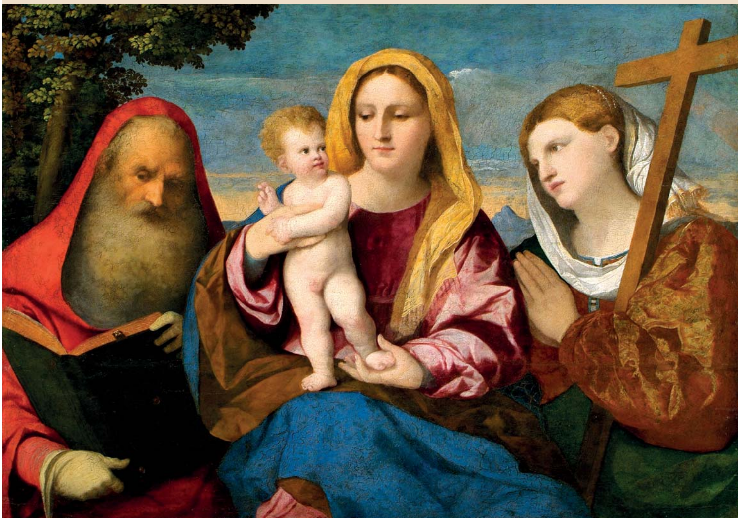
Palma il Vecchio (1480/1528), Madonna con Bambino tra i SS. Girolamo ed Elena - olio su tavola - 76x104 cm Pinacoteca dell'accademia dei Concordi Rovigo - esposta alla mostra "Bellini e i Belliniani" in Palazzo Sarcinelli a Conegliano.