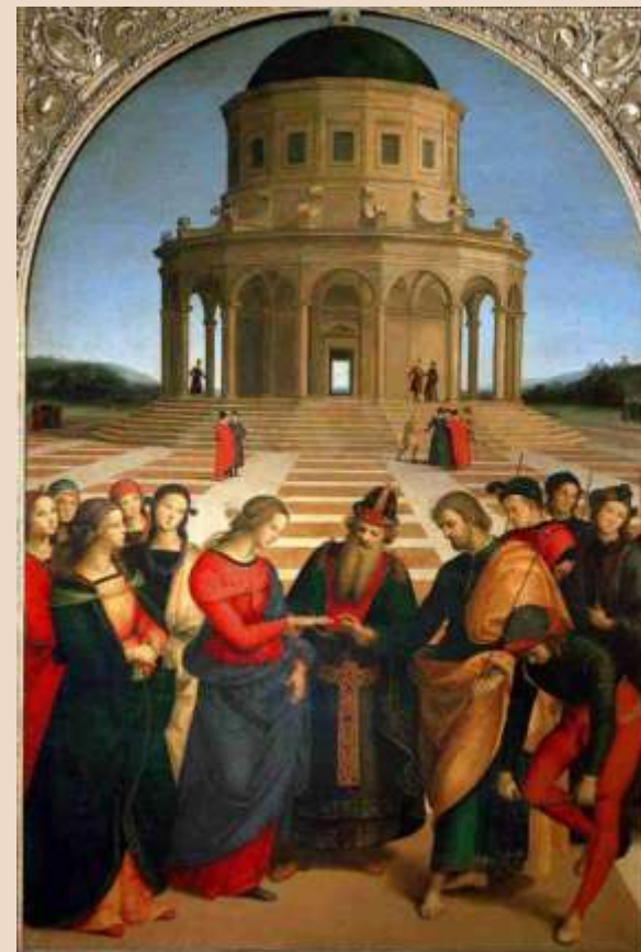
R. SANZIO, Sposalizio della Vergine , olio su tavola, 1504