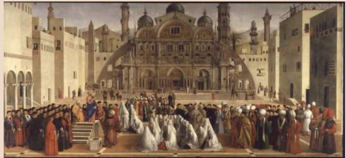
G. e G. BELLINI, L'ultima predica di S. Marco ad Alessandria d'Egitto , olio su tela, 1504-1507

Il percorso intende studiare le modalità di diffusione delle opere d'arte mettendo a fuoco la supremazia del sistema della committenza fino a tutto il 1400, il trapasso poi al gusto e alla moda del collezionismo, e infine l'affermarsi dal 1600 in avanti del vero e proprio mercato dell'arte, con tutte le implicite conseguenze per il ruolo dell'artista e per il valore dell'oggetto commerciato.