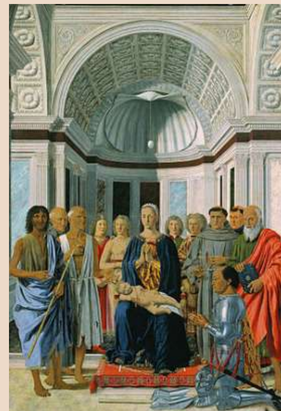
P. DELLA FRANCESCA, Pala Montefeltro , tempera e olio su tavola, 1469-1474

Il percorso verte sulle opere trecentesche e quattrocentesche, puntando a leggere il dipinto come testimone della qualità e della tipologia della corte nel cui ambito è stato prodotto.