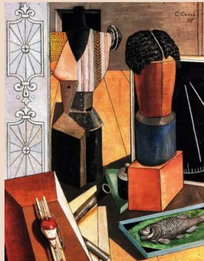
C. CARRÀ, La camera incantata , olio su tela, 1917