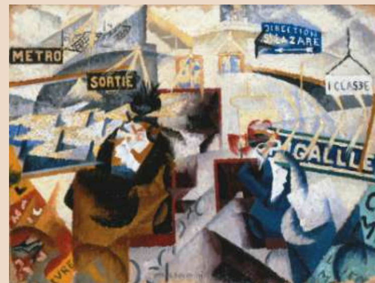
G. SEVERINI, Le nord sud , olio su tela, 1912