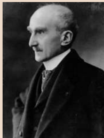
Henri-Louis Bergson (1859 – Auteuil, 1941) filosofo francese

Verranno esaminate opere nelle quali si riflettono i concetti filosofici dell'epoca di appartenenza, rappresentati da scelte formali in grado di alludere a valori concettuali.