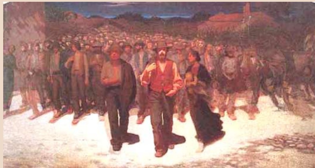
G. PELLIZZA DA VOLPEDO, Fiumana , olio su tela, 1895-1896

La funzione dell'arte come strumento di comunicazione di massa, capace di veicolare prima di tutto la celebrazione del potere sia politico sia sociale ed economico, è ben rappresentata da una serie di opere dal 1300 al 1800.