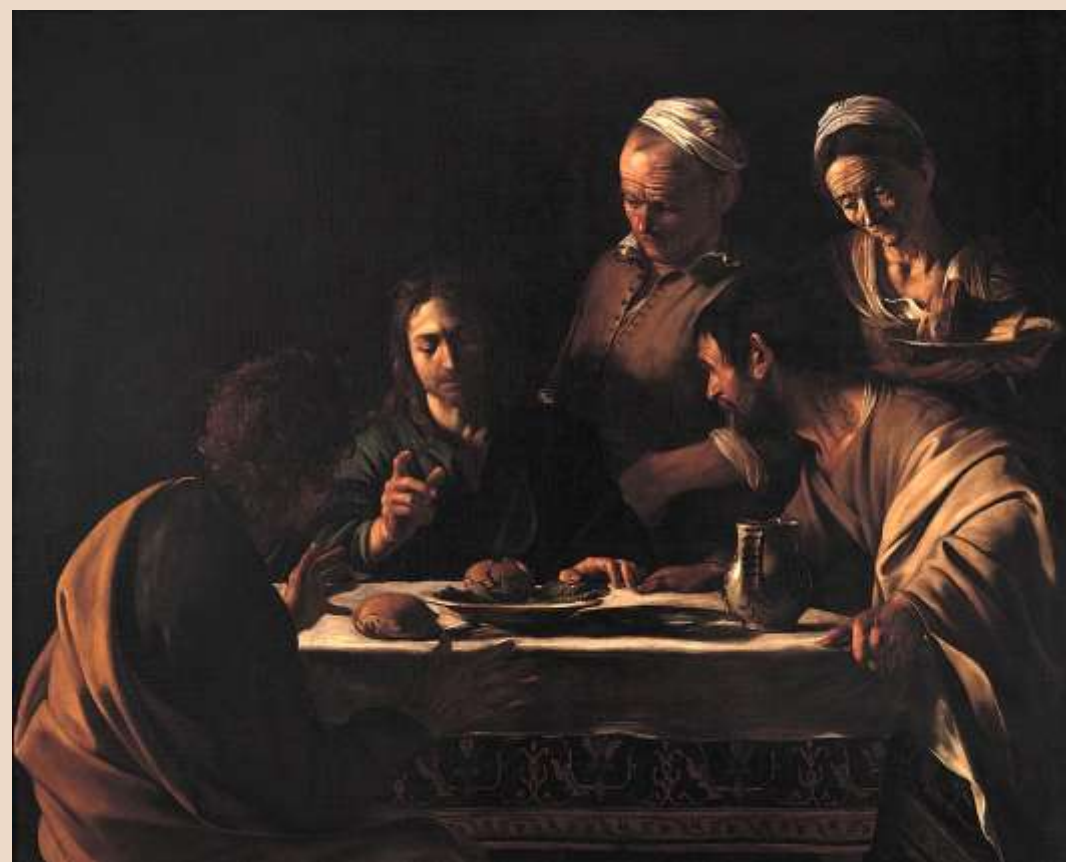
MICHELANGELO MERISI detto IL CARAVAGGIO, La cena in Emmaus , olio su tela, 1605-1606

I dipinti della Pinacoteca che possono essere considerati capolavori sono davvero numerosi e noti a tutti, ma non sempre è facile far capire ai ragazzi che cosa sia un capolavoro. Accompagnarli in un primo approccio con il dipinto, insegnare loro a leggere un'immagine, capire come ogni opera sia espressione e sintesi di una determinata epoca.