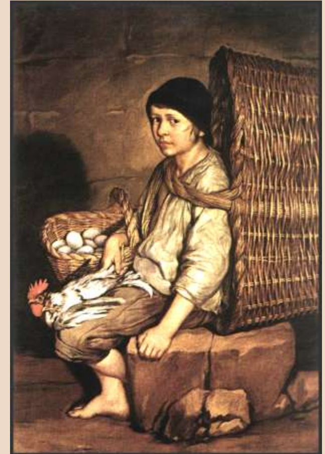
G. CERUTI, Portarolo seduto con cesta, uova e pollame , olio su tela, 1735 c.