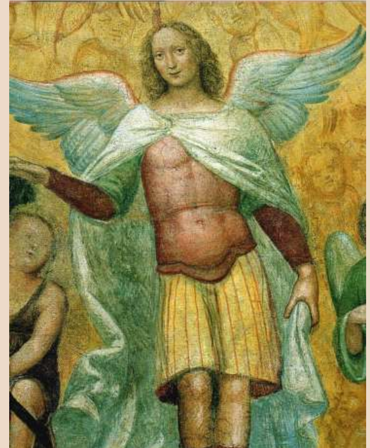
B. LUINI, Cappella di San Giuseppe , affreschi riportati su tela, 1525-1530