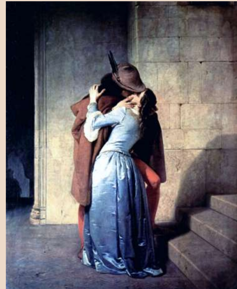
F. HAYEZ, Il bacio , olio su tela, 1859

Dal complesso rapporto con il cibo al lavoro minorile, dall'amicizia con i pari al rapporto con i genitori, dal bullismo all'amore, sono tanti i temi toccati in questo percorso, che non può seguire la storia dell'arte, ma solo le ragioni del cuore, che la ragione non può comprendere (Pascal).