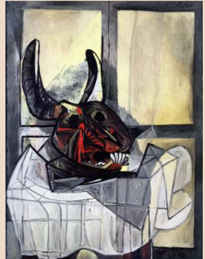
P. PICASSO, Testa di toro , olio su tela, 1942