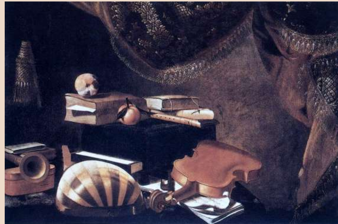
E. BASCHENIS, Natura morta con strumenti musicali , olio su tela, 1650 ca.