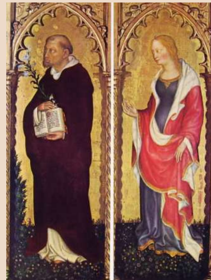
G. DA FABRIANO, Polittico di Valle Romita , tempera su tavola, 1410 ca. (part.)