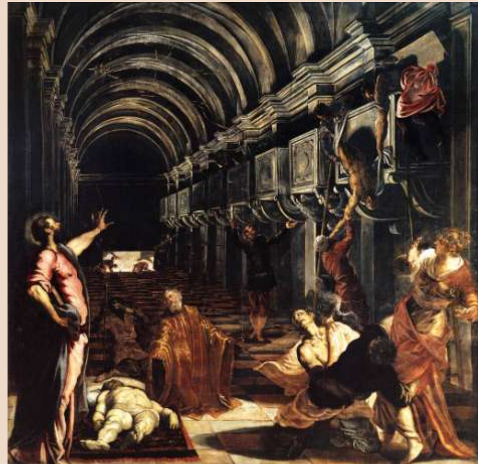
TINTORETTO, Il ritrovamento del corpo di San Marco , olio su tela, 1565 ca