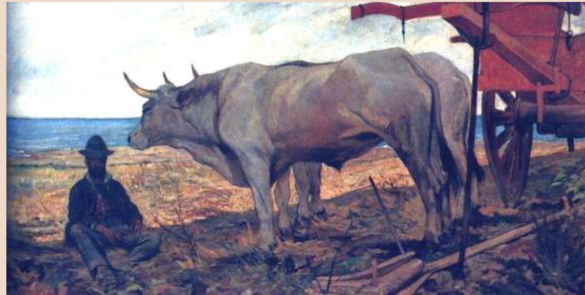
G. FATTORI, Il carro rosso , olio su tela, 1887