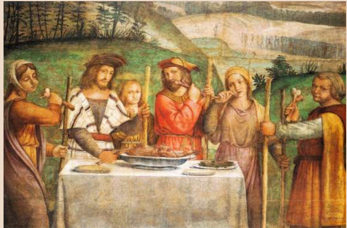
B. LUINI, Celebrazione della Pasqua , affresco strappato, 1520-1530

L'importanza del cibo, come fonte di vita, di salute, ma anche come occasione di incontro e come strumento di comunicazione di significati: partendo dai dipinti, ci si addenterà nell'analisi dei molteplici sensi che il cibo, nel corso del tempo, ha rivestito e riveste per il genere umano.