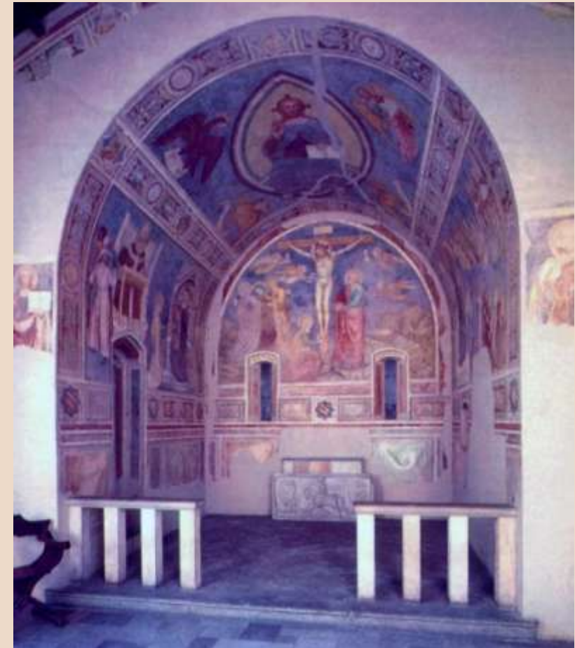
MAESTRO DELLA CAPPELLA DI MOCCHIROLO, Cappella di Mocchirolo , affresco staccato, 1370 ca.