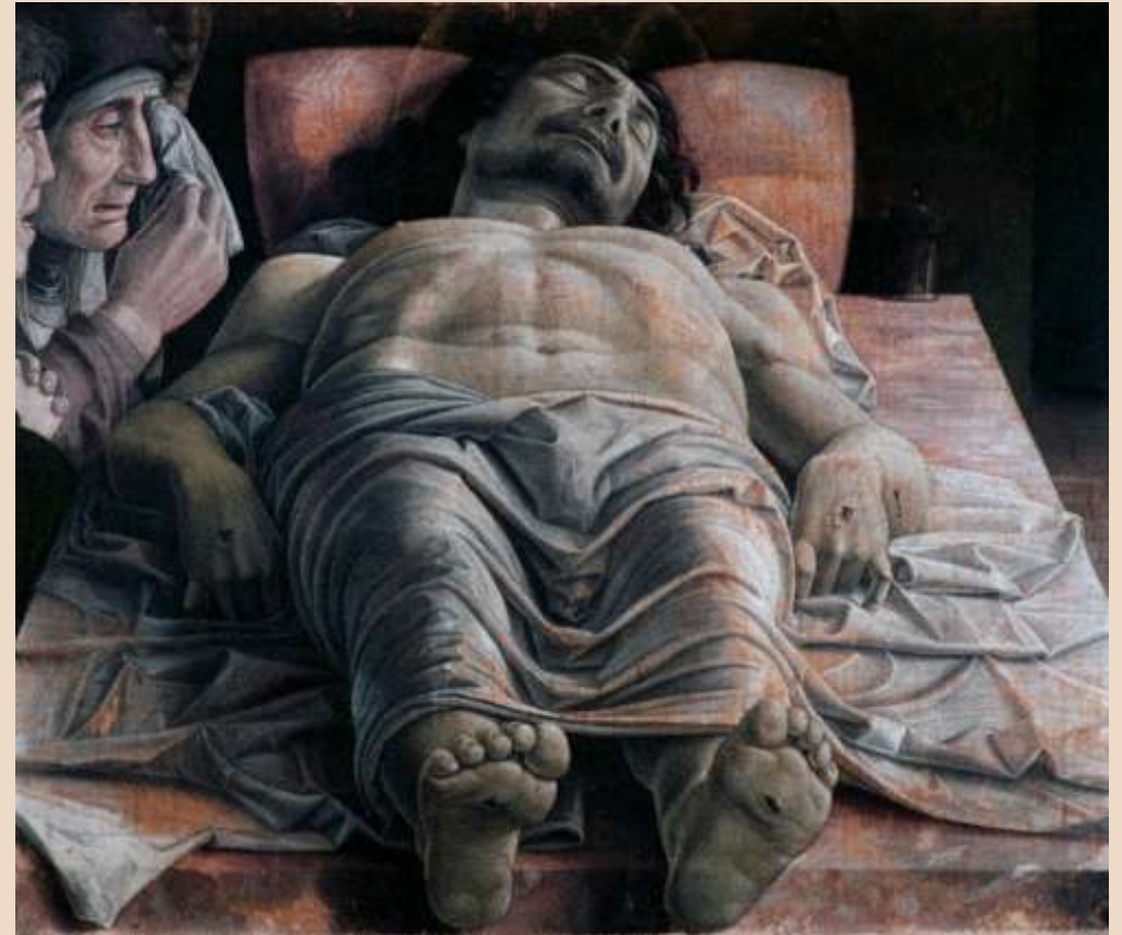
A. MANTEGNA, Cristo morto e tre dolenti , tempera su tela, 1500 ca.